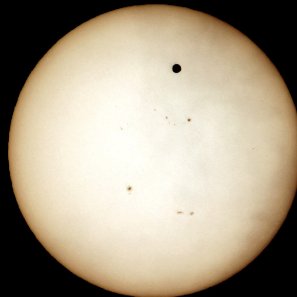
10h29m52s 1/2000sec ISO100