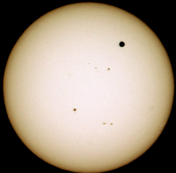
11h30m23s 1/2000sec ISO100