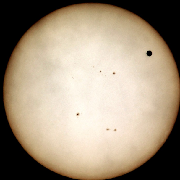
12h28m49s 1/1600sec ISO100