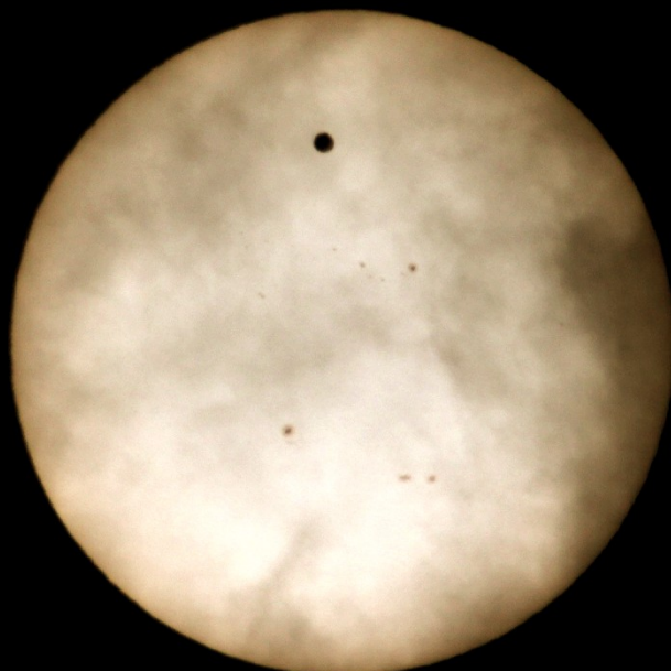
09h49m53s 1/1600sec ISO400