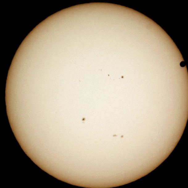
13h30m02s 1/1600sec ISO100

カメラ: キヤノン EOS Kiss X4 / レンズ: タカハシ FC-50+PENTAX リアコンバータ A2X-L(合成f1=800mm F16) / D47フィルター